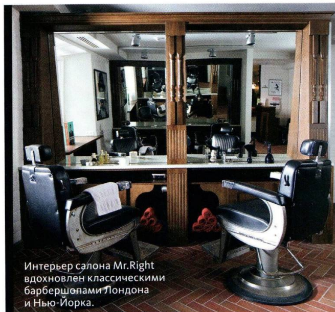
Интерьер салона Mr.Right вдохновлен классическими барбершопами Лондона и Нью-Йорка.

Туалетная вода Boss Bottled Night, цена по запросу.