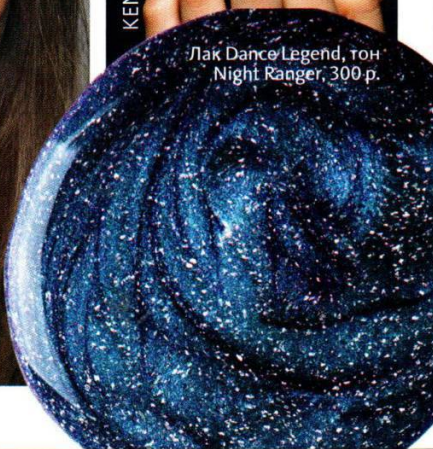
Лак Dance Legend, тон Night Ranger, 300 р.

Яркие розовые тени, как на показе VCBG, «подсвечивают» все лицо!