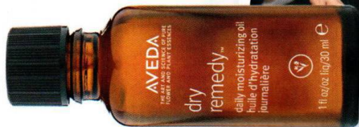
Масло для волос Aveda Dry Remedy Moisturizing Oil, 1950 р.

«Пейзанский стиль в большом городе» — так охарактеризовали узкие косы на затылке стилисты показов Marchesa и Tibi. «Сделайте акцент на проборе: заплетите тугую косичку от лба до макушки, — советует стилист Антуанетт Биндерс (Aveda). — А для блеска волос добавьте увлажняющее масло».