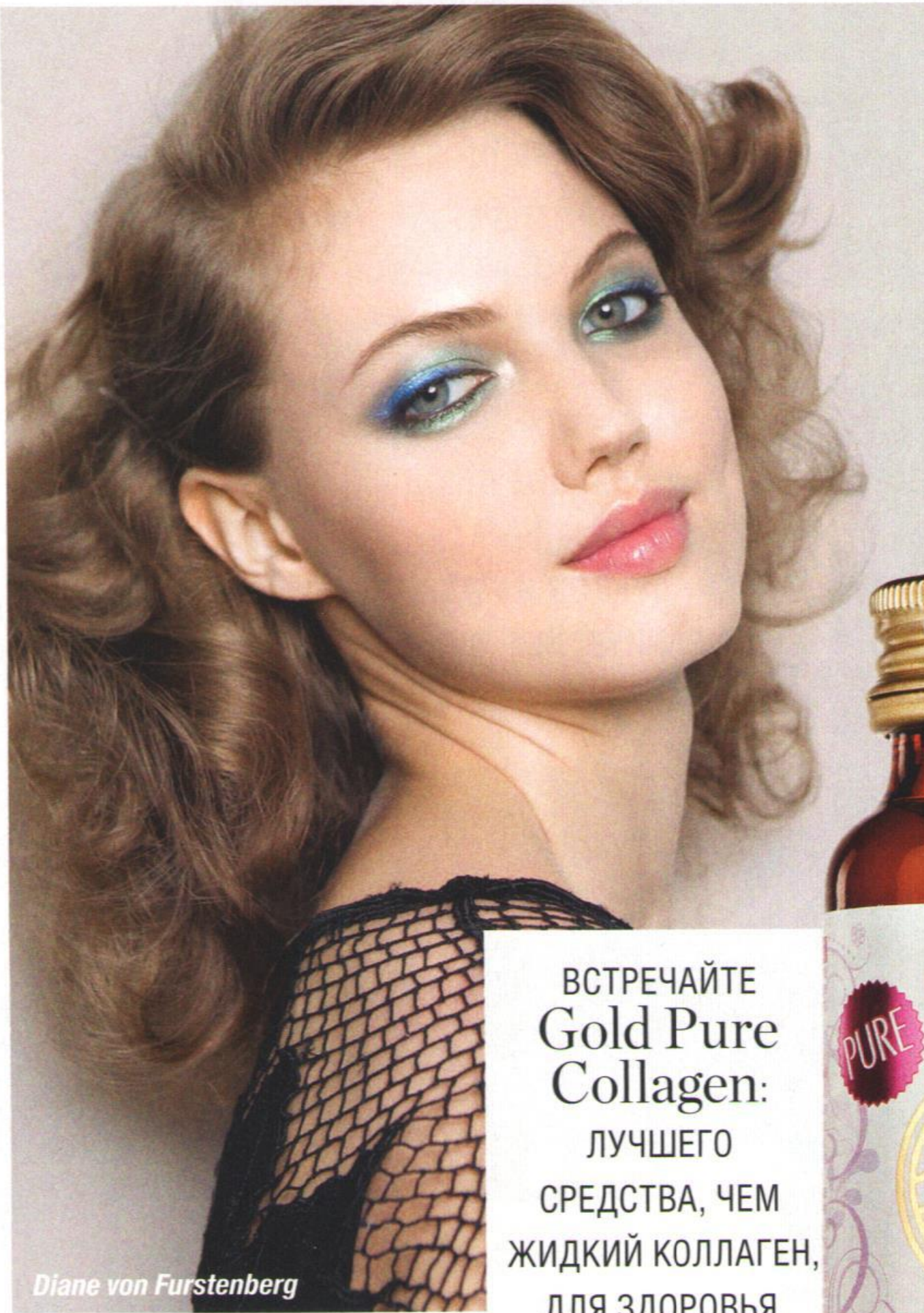
Diane von Furstenberg

Волосы я крашу если не всю сознательную жизнь, то большую ее часть – и ровно столько же пытаюсь восстановить их после каждой манипуляции. Впрочем, с обеими этими задачами мастерски справляется непревзойденный гуру колористики Кристоф Робин. Я познакомилась с ним много лет назад, когда Кристоф только начал сотрудничать с L'Oréal Paris . Но мало кто знает, что еще раньше Робин создал средства для окрашенных волос, которые и по сей день остаются бестселлерами. В ассортименте Christophe Robin у меня несколько фаворитов. Главный из них – лавандовое масло: ему, на мой взгляд, в мире вообще нет равных. И в этом со мной солидарны Катрин Денев, Натали Портман и Кристин Скотт Томас.