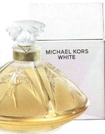
MICHAEL KORS WHITE

Аромат Boss Jour Pour Femme Eau de Parfum Lumineuse отдает должное белым цветам – фрезии, жимолости и ландышу.