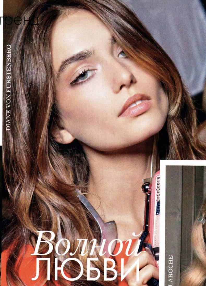
DIANE VON FURSTENBERG