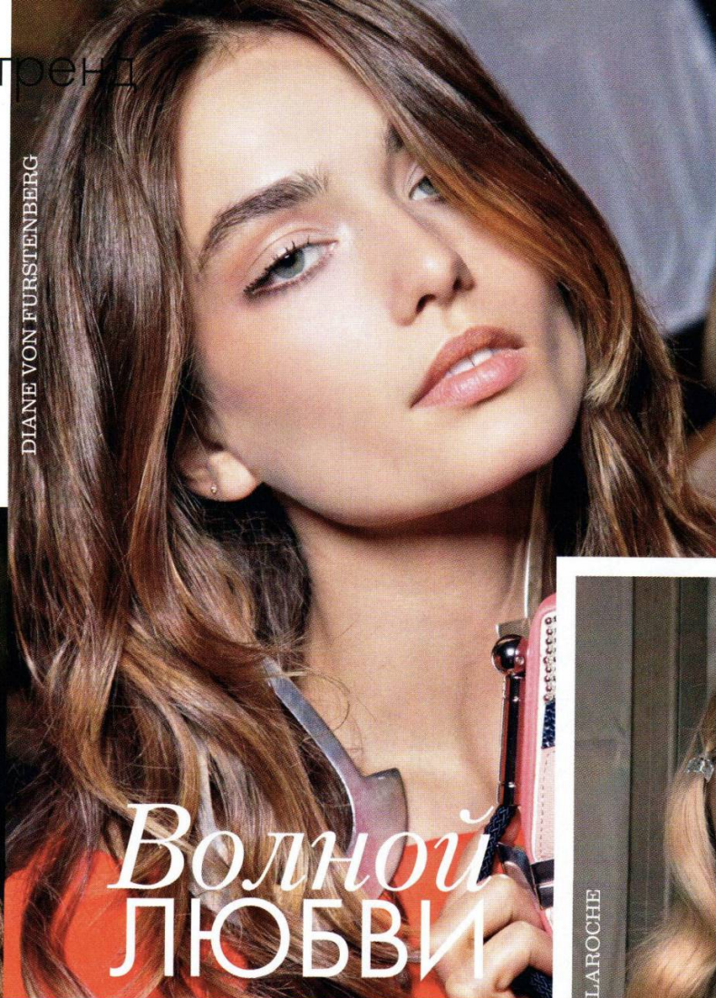
DIANE VON FURSTENBERG