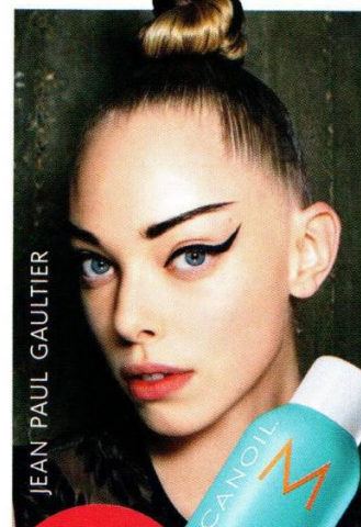
JEAN PAUL GAULTIER

Для большей пышности нанесите на волосы средство для объема.