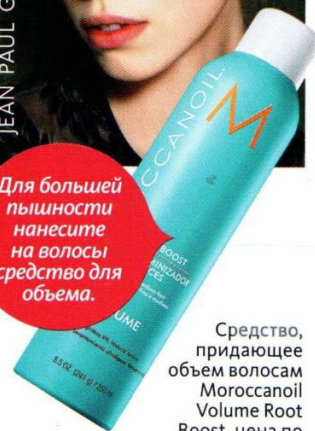
Средство, придающее объем волосам Moroccan Volume Root Boost, цена по запросу.

Для большей пышности нанесите на волосы средство для объема.