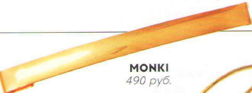
MONKI 490 руб.