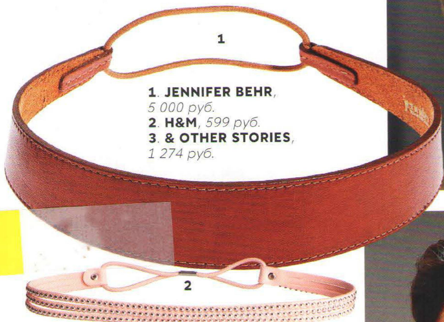
1. JENNIFER BEHR, 5 000 руб. 2. H&M, 599 руб. 3. & OTHER STORIES, 1 274 руб.

Аксессуары для волос придадут прическе индивидуальность и остроту.