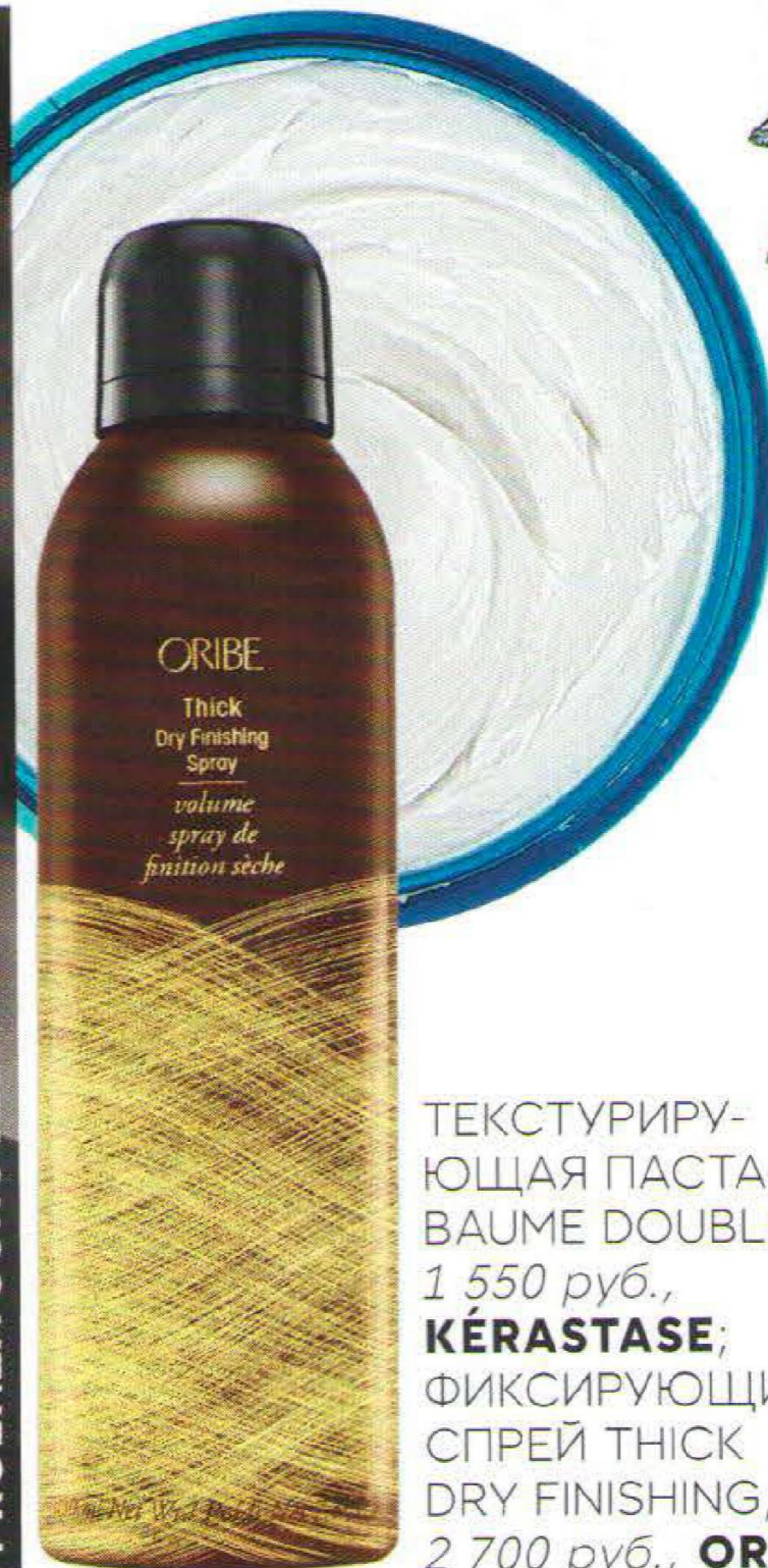
ТЕКСТУРИРУЮЩАЯ ПАСТА BAUME DOUBLE JE, 1 550 руб., KÉRASTASE; ФИКСИРУЮЩИЙ СПРЕЙ THICK DRY FINISHING, 2 700 руб., ORIBE.