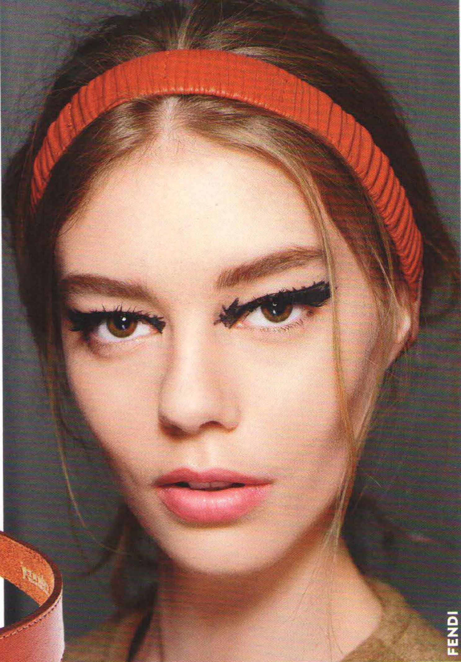
BANANA REPUBLIC 842 руб.