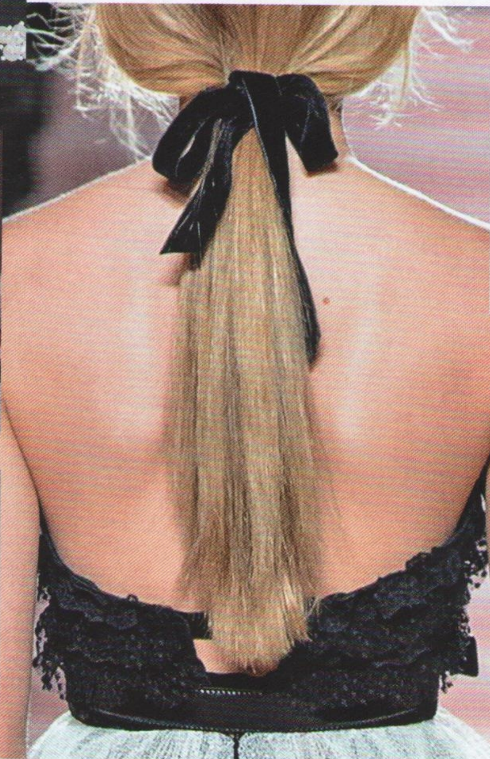
PHILOSOPHY DI LORENZO SERAFINI