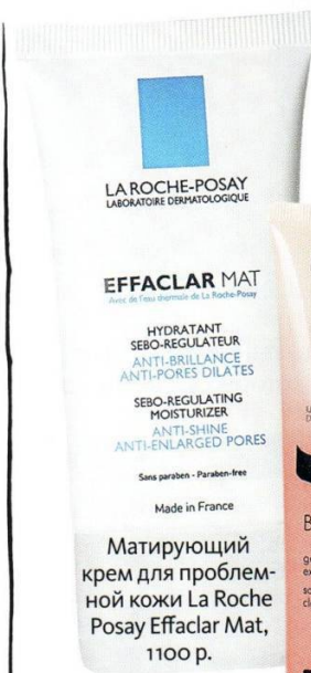
Матирующий крем для проблемной кожи La Roche Posay Effaclar Mat, 1100 р.