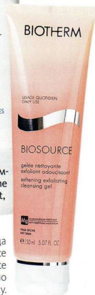
Скраб для лица Biotherm Biosource Gelée Nettoyante Exfoliant, цена по запросу.