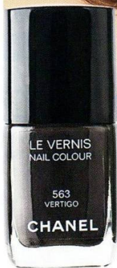
Лак для ногтей Chanel Le Vernis, тон 563 Vertigo, 1161 р.