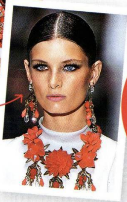
Средство против пушения волос John Frieda Frizz-Ease Hair Serum, 595 р.