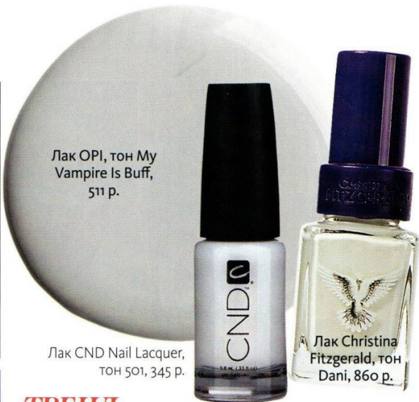
Лак OPI, тон My Vampire Is Buff, 511 р.