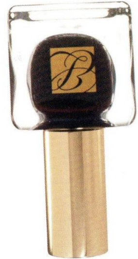
Estée Lauder E1 Black Iris, 1160 руб.