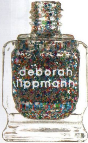
Deborah Lippmann Happy Birthday, 800 руб.