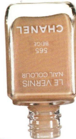
Chanel 565 Beige, 1160 руб.