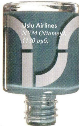
Uslu Airlines NYM (Niamey), 1130 руб.