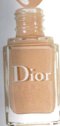
Dior 413 Grège, 1150 руб.