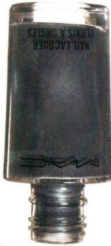
MAC Midnight Tryst, 630 руб.