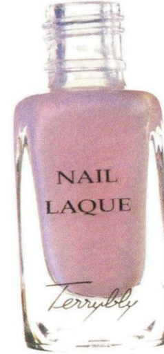
By Terry Bubble Glow Rose, 1270 руб.