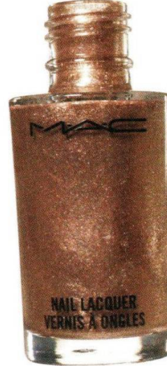
MAC Soirée, 630 руб.