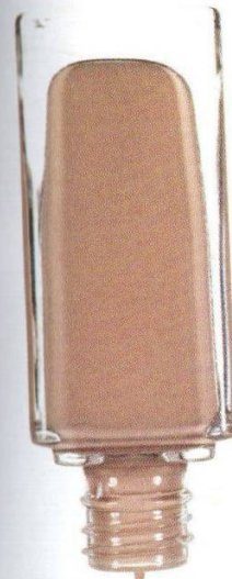
Dolce & Gabbana 220 Perfection, 1070 руб.