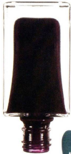
Tom Ford 10 Viper, 1600 руб.