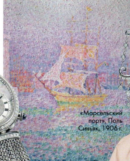
«Марсельский порт», Поль Синьяк, 1906 г.