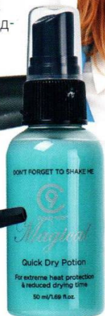
Термоспрей для волос Cloud Nine C9 Magical Quick Dry Potion, цена по запросу.