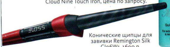
Конические щипцы для завивки Remington Silk C196W1, 1690 р.