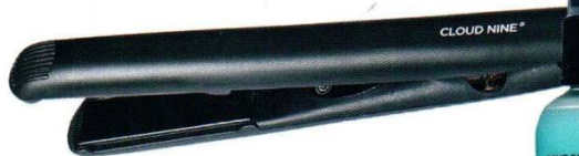
Автоматический стайлер для укладки Cloud Nine Touch Iron, цена по запросу.