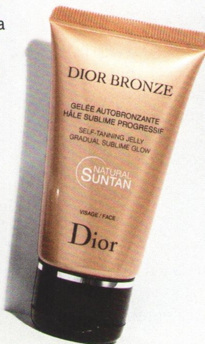
БРОНЗАТОР, DIOR , 2300 руб.

В тубике – желе с легкой текстурой, благодаря которой он моментально впитывается и вы не рискуете испачкать ворот белой рубашки. Придаст коже легкий тон загара, спрятав покраснения и другие «неприятности».