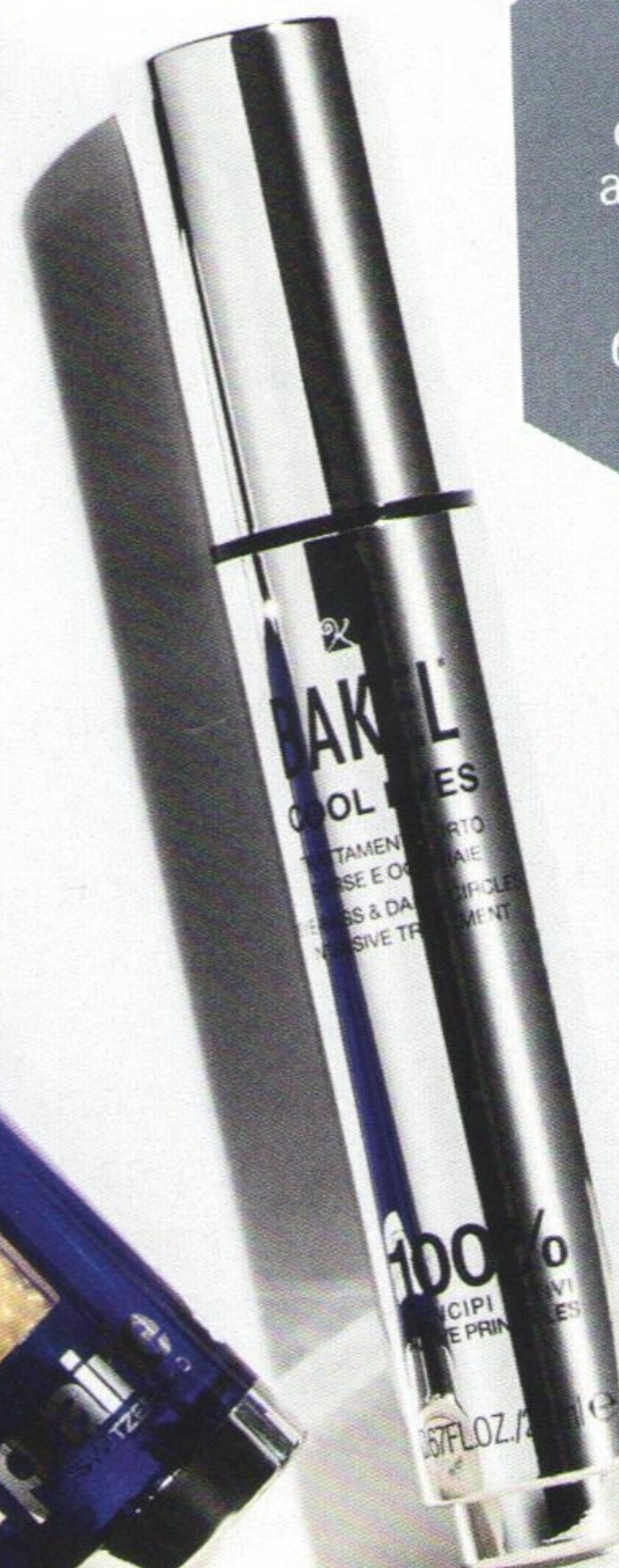
КРЕМ ДЛЯ ГЛАЗ, BAKEL , 7900 руб.

Икринки, содержащиеся в этом хайтек-флаконе, намазывают не на хлеб с маслом, а прямо на лицо – чтобы создать подтягивающий эффект.