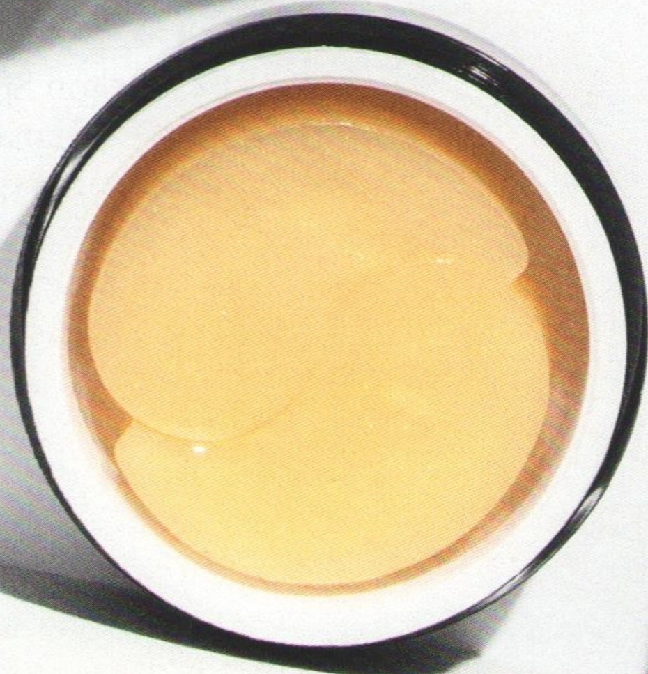
КРЕМ ДЛЯ ГЛАЗ, LA MER , 15 750 руб.

Думать, что патчи исключительно женский удел, – прошлый век. За 20 минут они разглядят кожу и снимут отечность, невзирая на ваш пол.