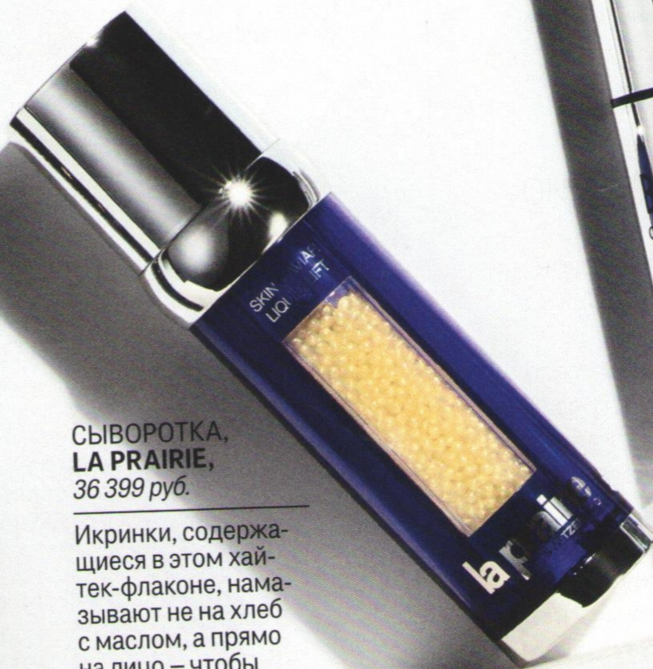
СЫВОРОТКА, LA PRAIRIE , 36 399 руб.

Возможно, в ночь мальчишника вы стали свидетелем вещей, к которым вас жизнь не готовила, и в результате – поседели. На помощь придет компактный спрей, способный замаскировать вашу впечатлительность.