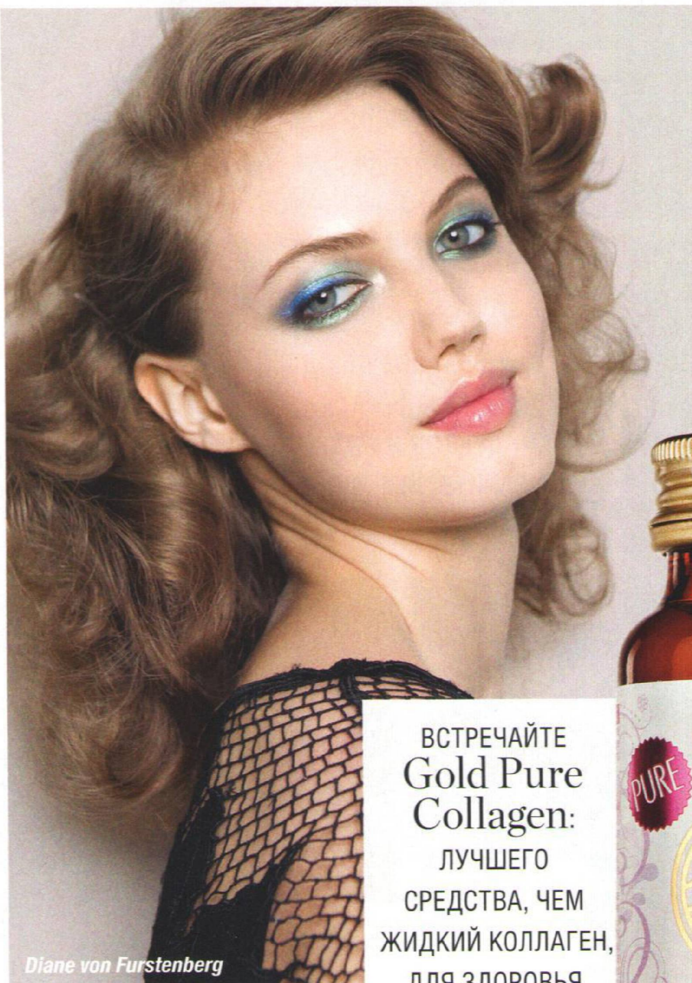
Diane von Furstenberg