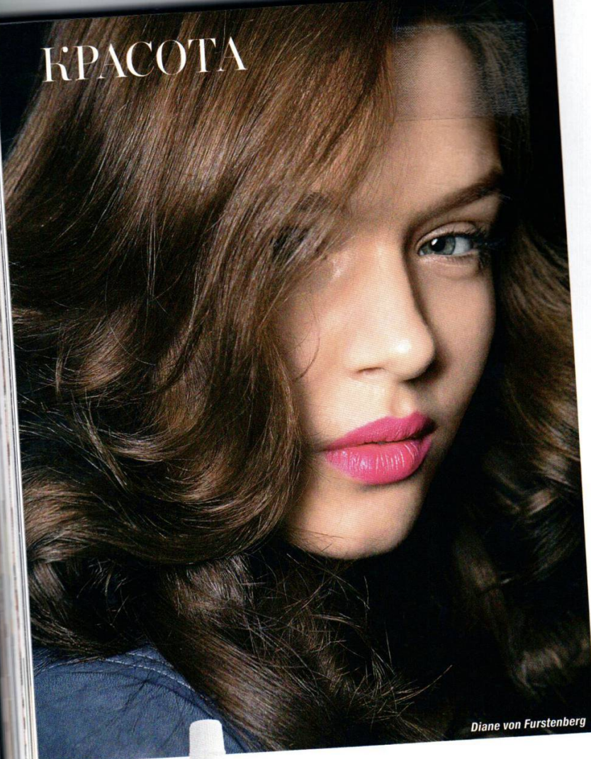
Diane von Furstenberg