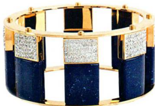
Браслет, Lele Sadoughi