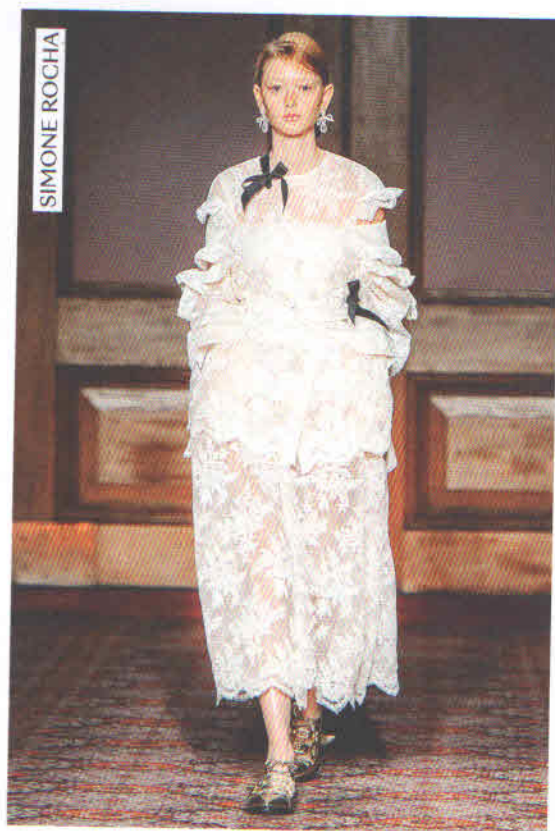
Романтизм и реализм